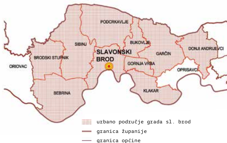
← Prikaz 3. Granice urbanog područja grada Slavenskog Broda; izvor: Odluka o sastavu urbanog područja Slavenskog Broda (2015.), http://www.slavonski-brod.hr/images/sluzbeni_glasnik/2015/sluzbeni_glasnik_4.pdf