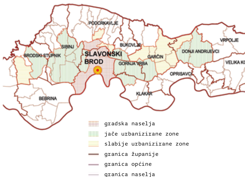
← Prikaz 2. Socioekonomske regije Slavenskog Broda 1981. godine. (karta sadrži današnji teritorijalni ustroj); izvor: Vresk, M. (1990.), Grad u regionalnom i urbanom planiranju, Zagreb